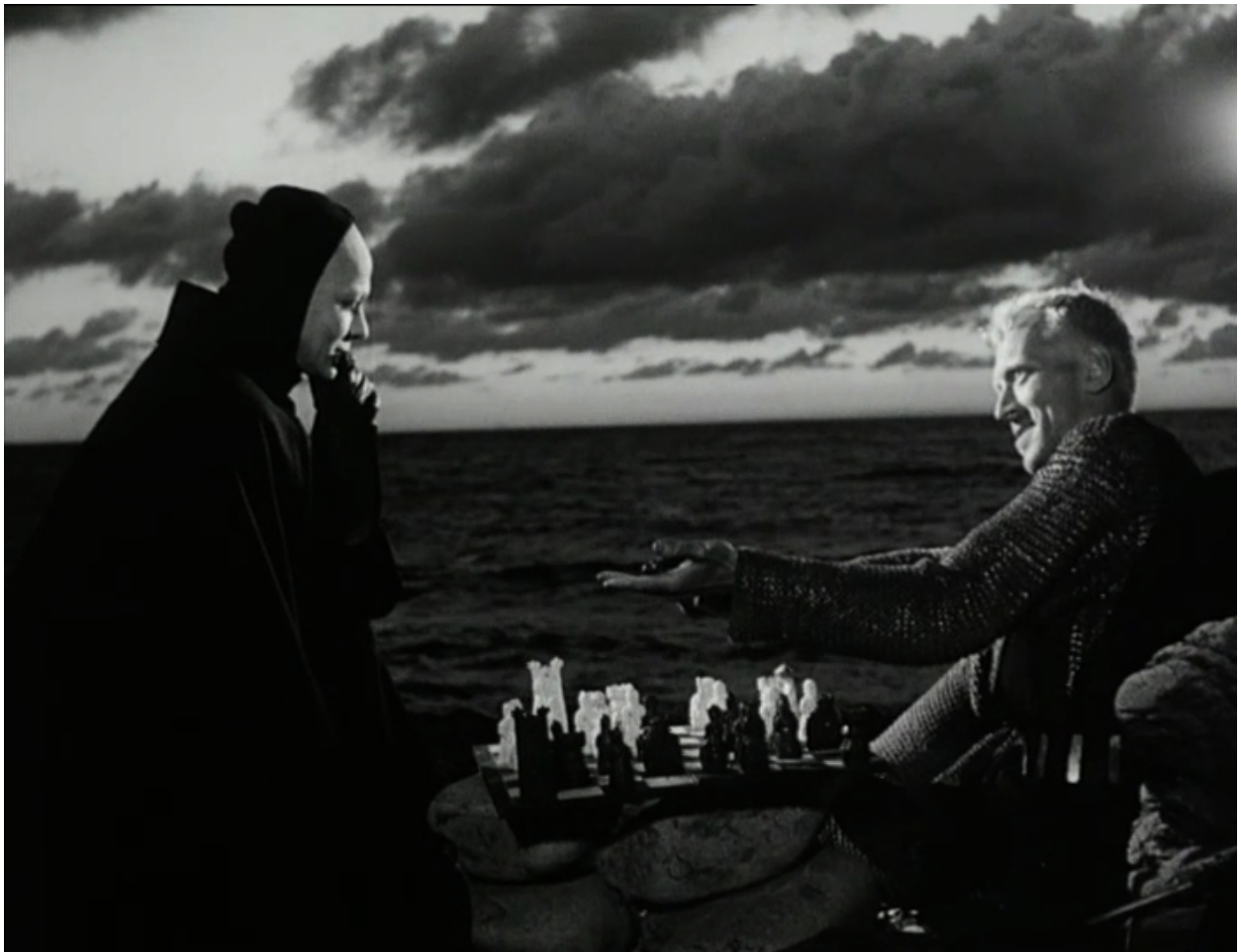
da "Il Settimo Sigillo" di Ingmar Bergman (1957)