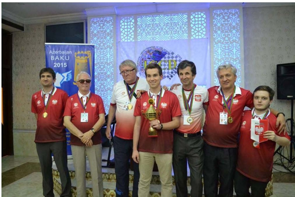
Polonia, Campione d'Europa I.C.C.D. per squadra maschile 2015